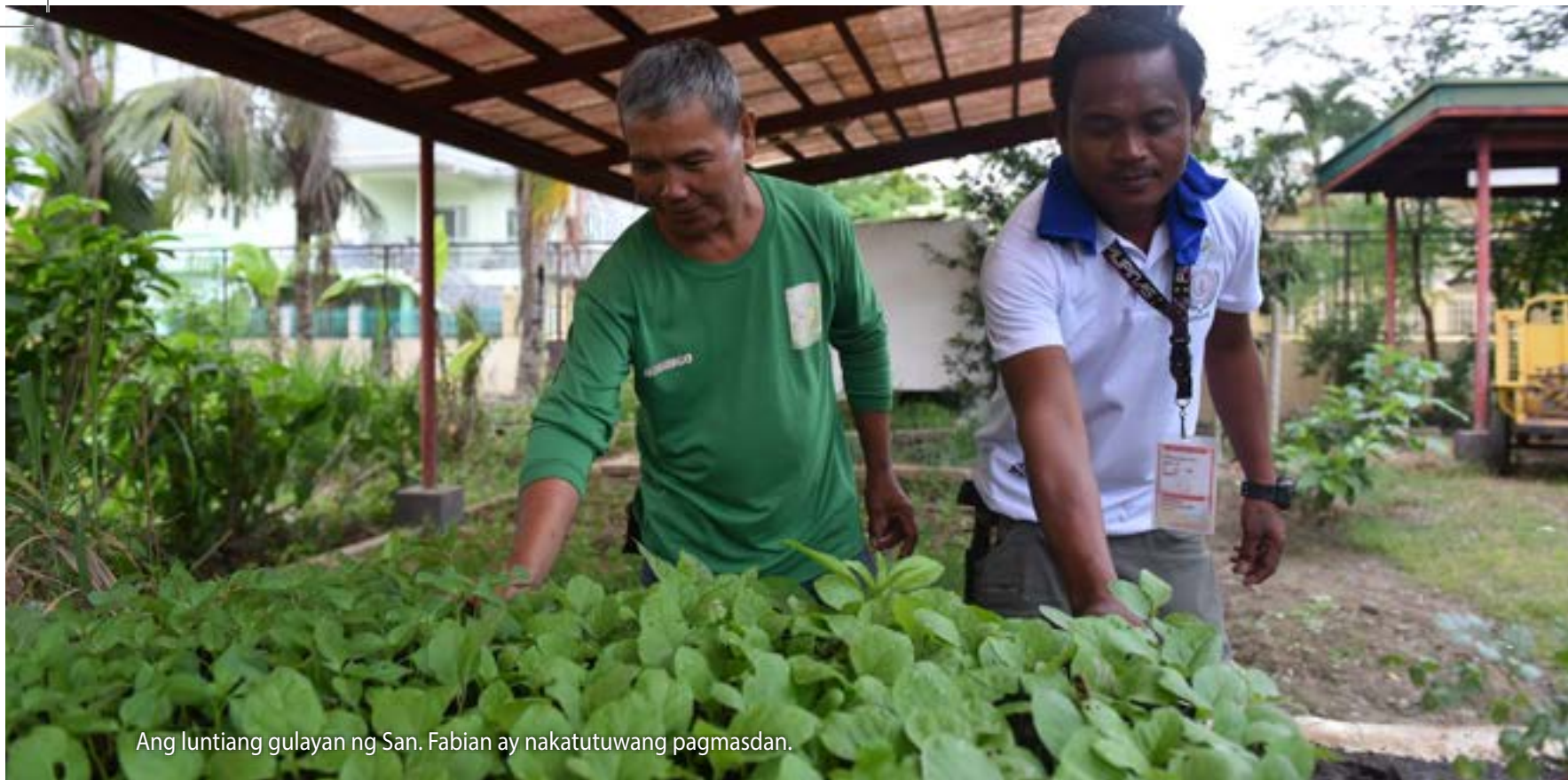
Ang luntiing gulayan ng San. Fabian ay nakatutuwang pagmasdan.