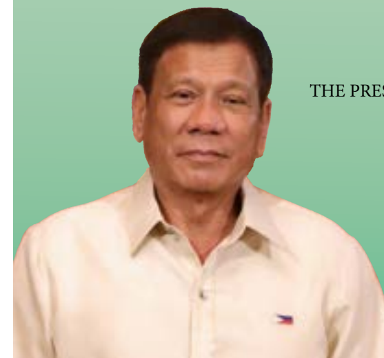
THE PRESIDENT OF THE PHILIPPINES