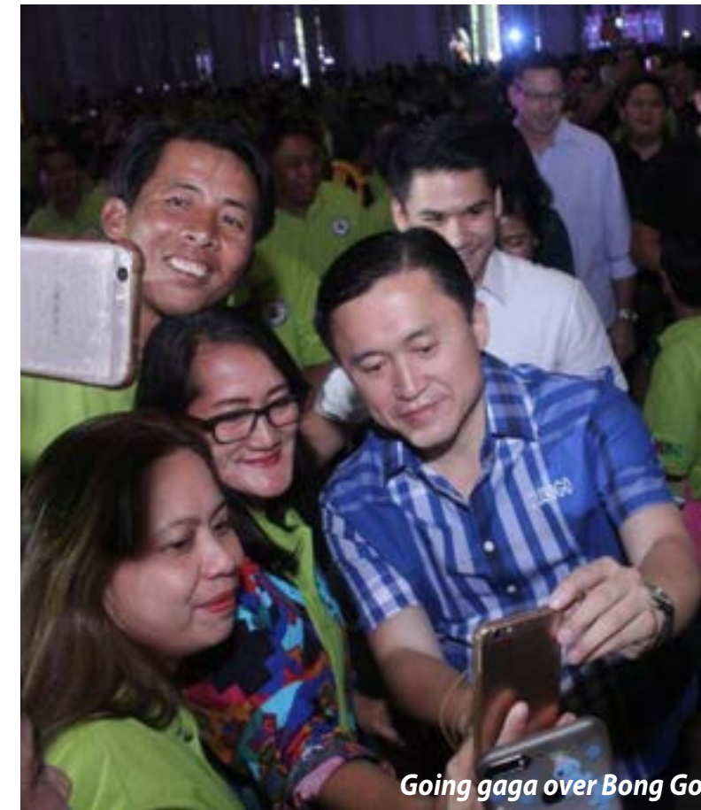
Going gaga over Bong Go.