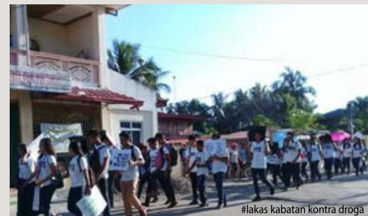
#lakas kabatan kontra droga