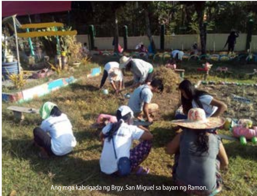
Ang mga kabrigada ng Brgy. San Miguel sa bayan ng Ramon.